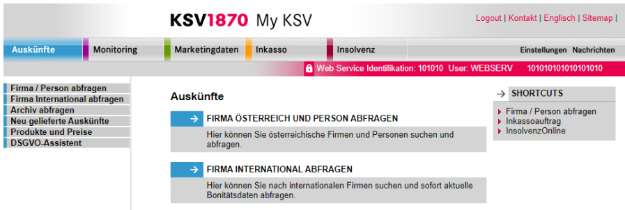
Abbildung: Online-Portal myksv.at

Bei Bestellung der KSV1870 Anbindung erhalten Sie auch Zugang zum Online-Portal My KSV und können dort weitere kostenpflichtige Zusatzdienstleistungen des KSV1870 in den Kategorien Auskünfte und Monitoring abrufen, Marketingdaten bestellen oder Inkasso und Insolvenzvertretungen erteilen.